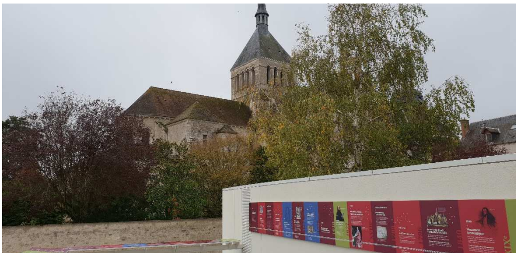
AGTC 45 151 Av Denis PAPIN 45800 ST JEAN DE BRAYE